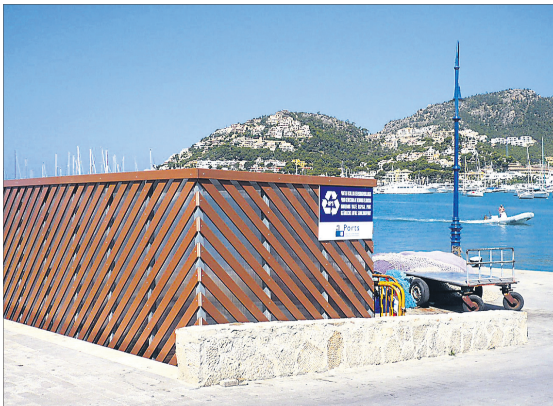
La caseta del Port d'Andratx evita l'impacte visual dels dipòsits de recollida.

Estadístiques i actituds que, en suma, evidencien que navegants i pescadors han interioritzat la conducta sostenible.