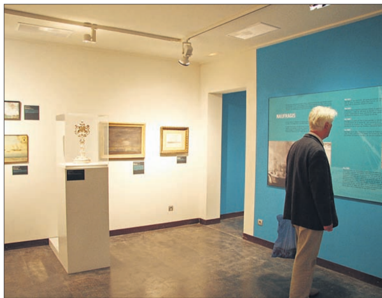
Un visitant de l'exposició 'La fe i la mar' del Museu Diocesà de Mallorca.

Aquesta mostra, organitzada pel Bisbat de Mallorca i la Direcció General de la Mar del Govern de les Illes Balears, pretén mostrar la relació entre la fe cristiana i la mar, que s'ha manifestat a Mallorca de forma molt intensa, sobretot, entre els col·lectius professionals vinculats a aquest mitjà, com són pescadors i mariners. L'exposició alberga exvots de naufragats, representacions de Sant Elm o de la Verge del Carme