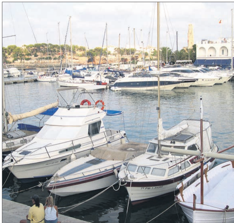
Imatge del Club Nàutic de Porto Cristo.

Les instal·lacions portuàries menorquines de Fornells, Addaia, Ciutadella i Marina de Cala'n