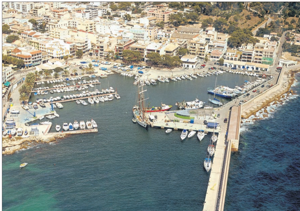
Imatge aèria del port mallorquí de Cala Rajada.

La seva flota pesquera formada per dos vaixells d'arrosament i 27 embarcacions d'arts menors, és famosa per estar