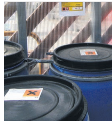
Diferents dispositius de recollida de residus en els ports de Sant Antoni de Portmany, Cala Bona i Porto Cristo.