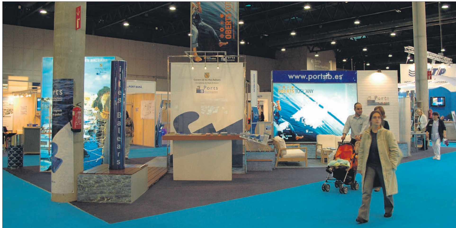
L'estand modular de Ports dels Illes Balears en el Saló Nàutic Internacional de Barcelona va rebre nombroses visites.