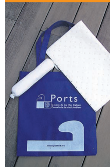
Imatge del 'kit' de Ports.