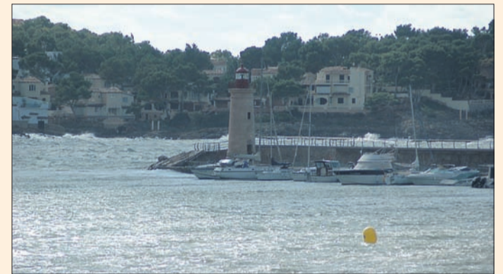
Far del Port d'Andratx 24 hores després de la tempesta