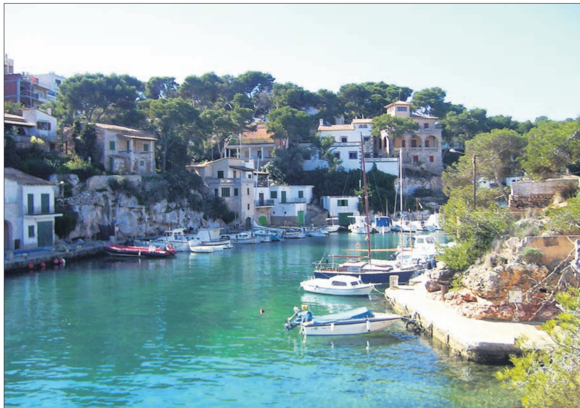
Actualment el port de Cala Figuera actua com a base regular de cinc barques de bou que descarreguen peix diàriament.

Des d'aleshores, la cala començà un procés d'urbanització, principalment de xalets integrats entre l'espessa pineda que envolta el port i que va anar creixent a partir del boom dels