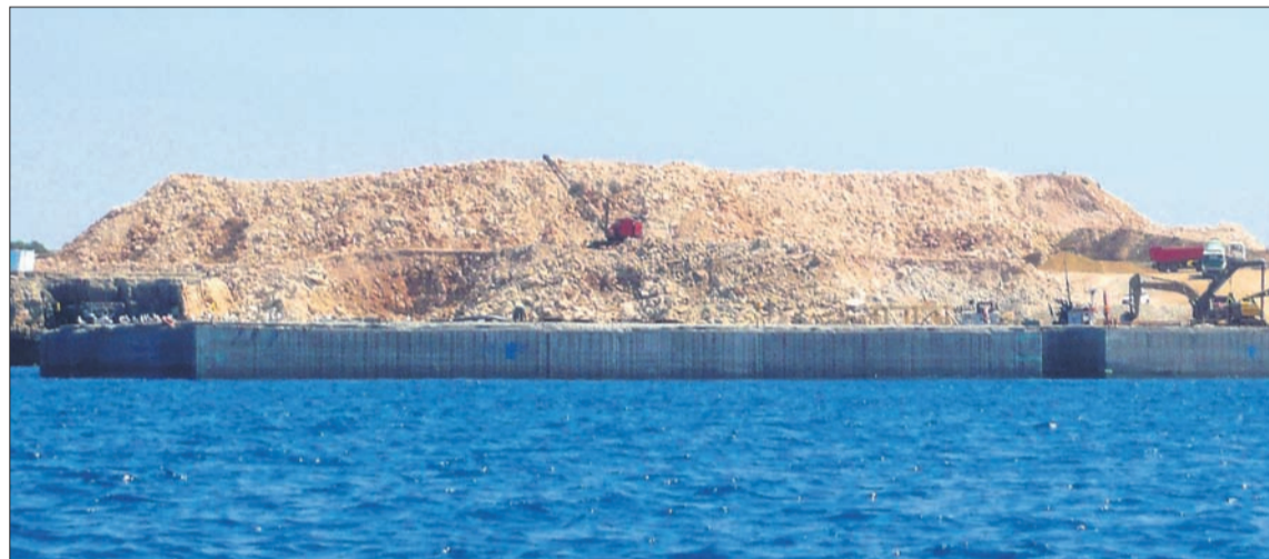
En menys d'un mes s'han instal·lat sis calaixos flotants, de forma que ja s'han executat 240 m 2 del nou dic exterior.

Cal dir que el model de doble dic planificat per al port exterior de Ciutadella és únic en Espanya, ja que mentre que en el cas de Menorca l'estructura comptarà amb dos espigons i amb una altura màxima de quatre metres per damunt del nivell del mar, el disseny més habitual a la resta del país