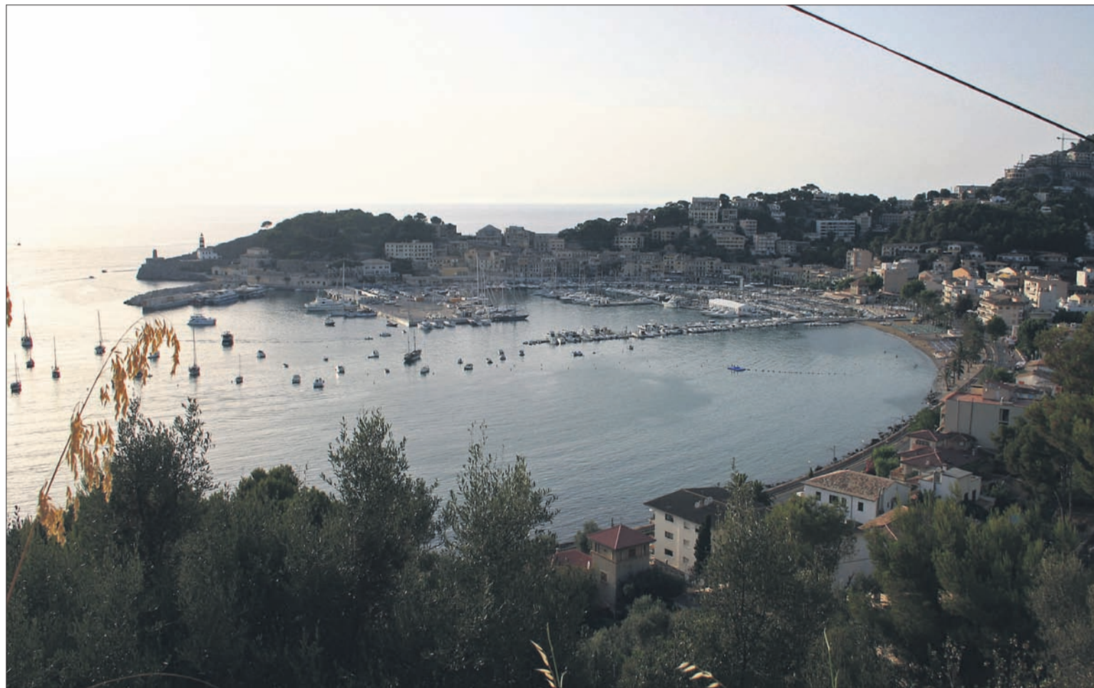
El Port de Sóller (en la fotografia) és, juntament amb els de la Colònia de Sant Jordi i el de Sant Antoni, els que més reserves per Internet han registrat.

El sistema de reserves on line de Ports de les Illes Balears ha registrat enguany, fins al dia 25 d'agost, un total de 1.139 reserves, concentrades bàsicament en els ports de gestió directa de la Colònia de Sant Jordi, Sant Antoni de Portmany, Sóller, Pollença i Fornells. L'oferta diària de places on line supera actualment els 160 llocs d'amarrament, front a les 55 amb les quals s'inicià el programa.