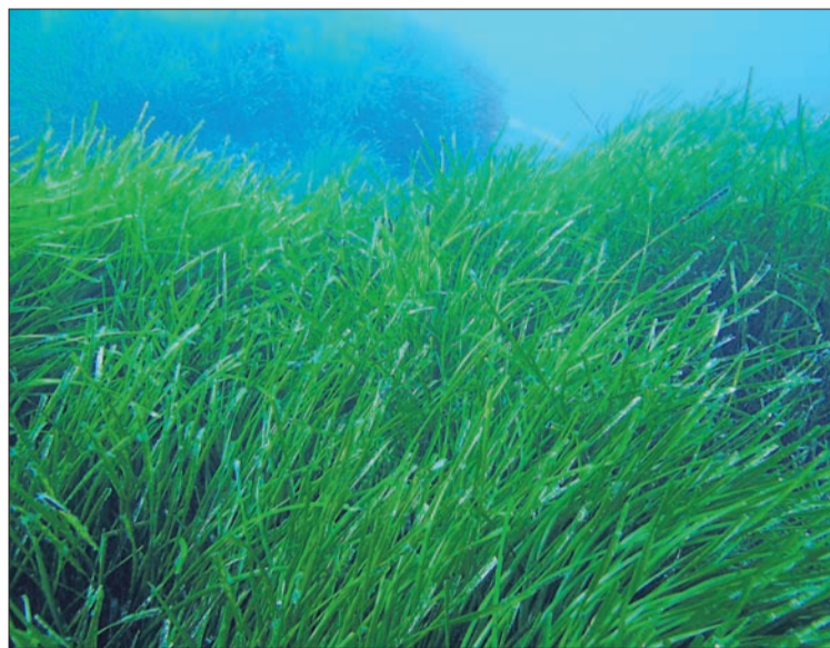
Els prats de posidònia han trobat un bon aliat en les boies ecològiques.

Boies ecològiques per evitar l'ancoratge en el fons marí i contribuir, d'aquesta forma, a la preservació de la posidonia oceanica , un alga vital per a la mar i per a la conservació i desenvolupament de les espècies marines. La necessitat de contribuir a la preservació d'aquest patrimoni natural, dugué el Govern balear a distribuir, entre els mesos de juny i setembre i per diferents llocs de les Balears, fins a 400 punts de fondeig ecològic que, segons les previsions de la Conselleria de Medi Ambient, durant la temporada estival de 2008 podrien ser