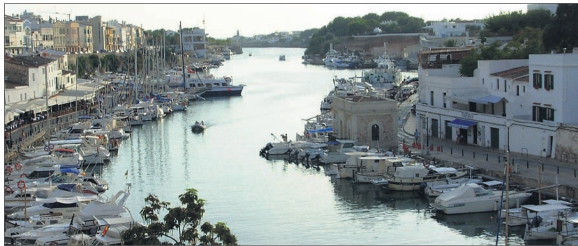
Vista de l'interior del port de Ciutadella, del que desapareixerà el tràfic de bucs de passatge.

consisteix a l'edificació d'un únic espigó amb altures que poden arribar fins als 12 metres.