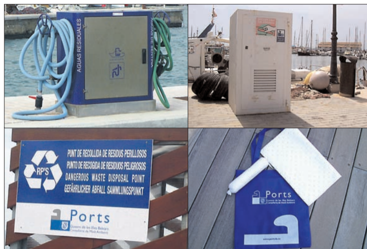
D'adalt a baix i d'esquerra a dreta podem veure les màquines d'eliminació de sentines, els contenidors per a la recollida d'elements pirotècnics, el cartell identificador dels espais de recollida dels residus perillosos i el kit ambiental.

Ara, Ports de les Illes Balears dona una nova passa endavant i