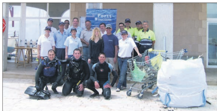
Els participants a la jornada de neteja mostren alguns dels «tresors» trobats.

Un total de sis bussejadors voluntaris participaren a una diada dissenyada d'alguna forma per predicar amb l'exemple i, a la vegada, per mostrar la