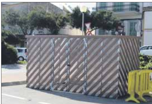
'Eco-contenedor' de Porto Colom.

Pollença, als quals s'han d'afegir els de Cala Bona, Cala Ratjada i Portocristo, que ja en tenien. La caseta, de 9 metres quadrats de superfície i fabricada amb panells de policarbonat i amb unes làmines de plàstic reciclat que imiten la fusta, està condicionada per a la recollida dels residus tòxics perillosos, de manera que disposa de bidons per dipositar envasos plàstics i metàl·lics contaminants, aerosols, absorbents, restes de pintura i filtres d'oli. Disposen a més d'un dipòsit de 500 litres per a l'oli mineral i d'un altre per a la recollida de bateries.