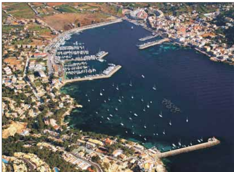
Imatge panoràmica del Port d'Andratx, amb els amarraments de Ports de les Illes Balears i el Club de Vela.

manté i que propicia una oferta constant de peix fresc molt valorada pels residents i pel sector de la restauració. Com diu Rafael Soler, el port d'Andratx va ser també un dels objectius predilectes dels atacs dels corsaris turcs que fustigaren l'illa en el segle XVI. Un acorralament que, a la vegada, propicià que el port acullí avui elements patrimonials de gran interès històric i arquitectònic, dels quals ens donen bona mostra, entre d'altres, la torre de Sant Carles. Aquesta torre de