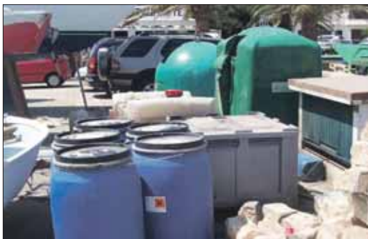
Abans dels 'eco-contenidors'.

Precisament aquest és l'objectiu dels eco-contenidors que ha començat a distribuir Ports de les Illes Balears i dels quals ja disposen els ports de Fornells, Portocolom, Sóller, Andratx i