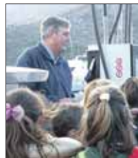
Un moment de la visita.

El passat 12 de desembre va ser un dia especial per als alumnes del Col·legi San Vicente de Paül de Sóller. Convidats per Ports de les Illes Balears, i emmarcada dins les activitats programades per aquest organisme per tal que la gent conegui i visqui els ports i, els nins tingueren una ocasió