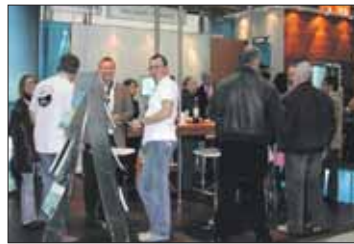
Expositor de Balears en la fira de Düsseldorf.

obligada d'aquesta nova etapa que escometen els ports illencs serà la World Travel Market de Londres, un mostrador internacional i principal referent per als agents del sector turístic. Dintre de les nostres fronteres, la propera edició de Fitur esdevindrà, també, una ocasió excel·lent per procurar el coneixement a fons de les instal·lacions portuàries de la nostra comunitat i les innumerables opcions per gaudir que ofereixen. Però a més de garantir la presència dels ports a les cites turístiques més importants, Ports de les Illes Balears es proposa ampliar la seva participació en les fires sectorials i, també en aquest cas, sortir a l'exterior, amb força. Els salons nàutics de Madrid, Barcelona i Palma són