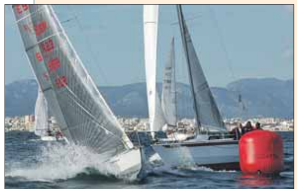
El Trofeu es celebra aquest any a la Badia de Palma.

El pròxim 13 de març s'inaugurarà l'exposició de tots els treballs que s'han presentat -i s'han admès- al concurs d'avantprojectes arquitectònics convocat en el seu moment per Ports de les Illes Balears amb vista a la construcció de l'estació marítima del port exterior de Ciutadella. La mostra serà inaugurada a les 20.00 hores del 13 de març i es podrà visitar a la seu del Col·legi Oficial d'Arquitectes de les Illes Balears (calle Portella, 14, Palma) de dilluns a divendres, entre les 10.00 i les 17.00 hores (de 10.00 a 15.00 hores els divendres).