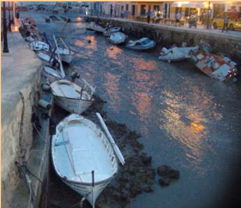
Baixada del nivell de la mar al Port de Ciutadella com a conseqüència de "la rissaga". Bajada del nivel del mar en el Port de Ciutadella debido a "la rissaga".