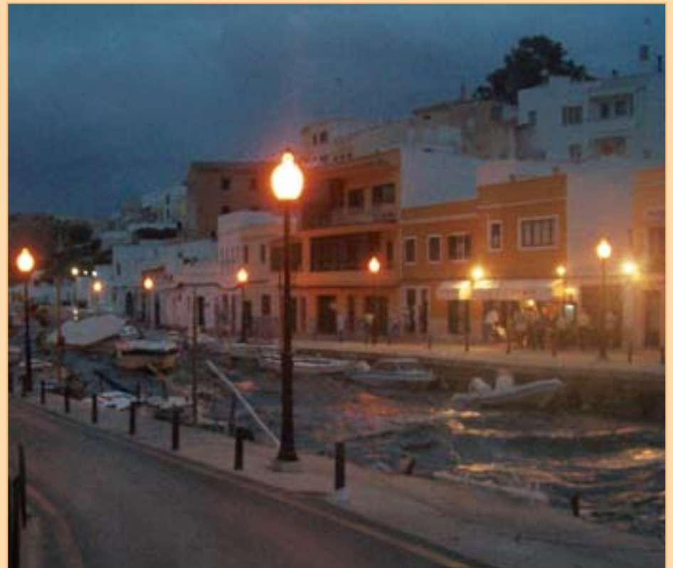
Entrada de l'ona provocada per "la rissaga" al Port de Ciutadella. Entrada de la ola provocada por "la rissaga" en el Port de Ciutadella.