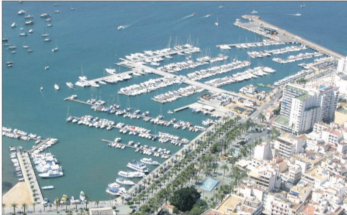
Imatge aèria del port de Sant Antoni de Portmany.

I també han estat els motius de seguretat els que han propiciat la reforma feta al port de Porto Cristo , que aquest estiu ha estre-