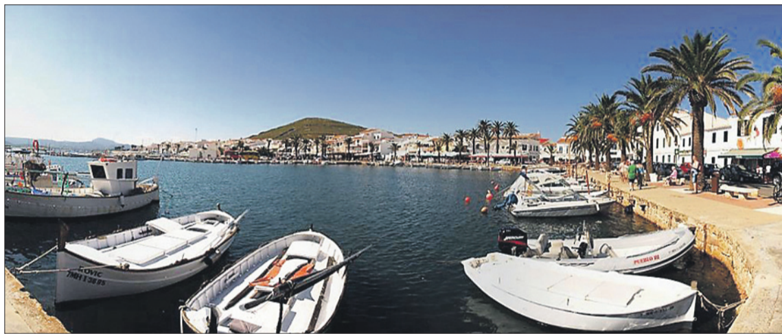
Dues imatges panoràmiques del Port de Fornells.