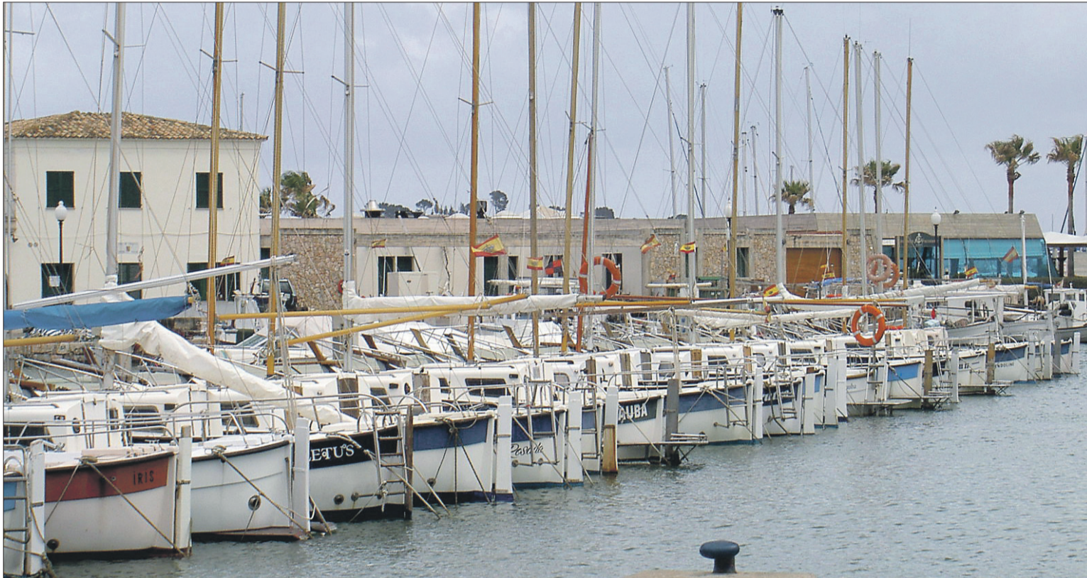
L'actualització de les llistes d'espera és una de les mesures adoptades per guanyar noves places d'amarrament de forma sostenible.