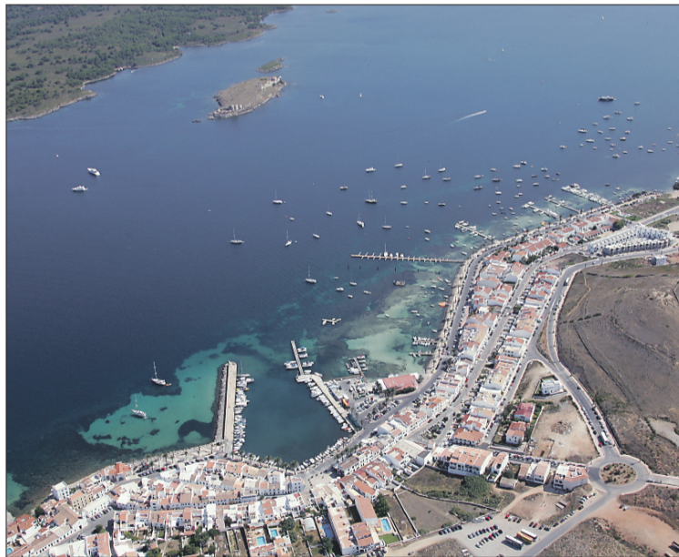
Fornells disposa de 115 amarratges gestionats directament per Ports IB.

sencera sigui considerada com la capital gastronòmica de la llagosta vermella.