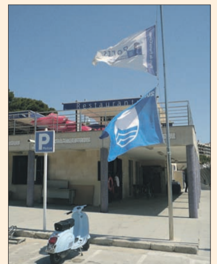
Les banderes de Porto Cristo a mig pal.