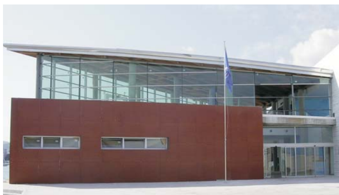
Estació marítima de Sant Antoni de Portmany. Estación Marítima de S. Antonio de Portmany.

Tanmateix és significatiu l'avanç en passatge del port de Ciutadella que es configura com el principal nucli de trànsit de línia regular entre illes, i també amb la Península, compta amb 219.893 passatgers, molt per davant de Maó que va obtenir el passat 2005, 167.523 passatgers.