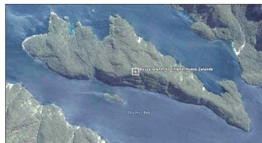
A BAUZÁ ISLAND. Google Earth devuelve esta imagen al introducir las palabras «Bauzá Island» en el buscador. Es el mismo islote que aparece en el centro del antiguo mapa. Está en la isla sur de Nueva Zelanda.

Ambos fueron grandes amigos y mantuvieron una larga relación epistolar y que posiblemente tuvo influencias científicas.