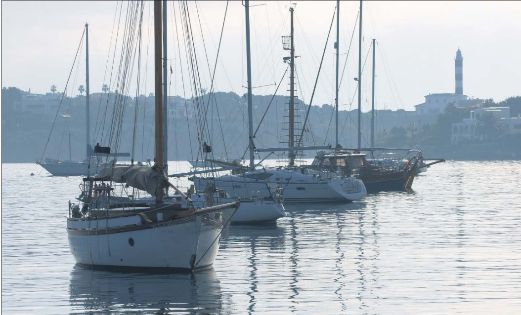
El Govern vol guanyar espai físic perquè tothom pugui amarrar a port, una iniciativa que contribuirà, a la vegada, a reduir els fondejos.