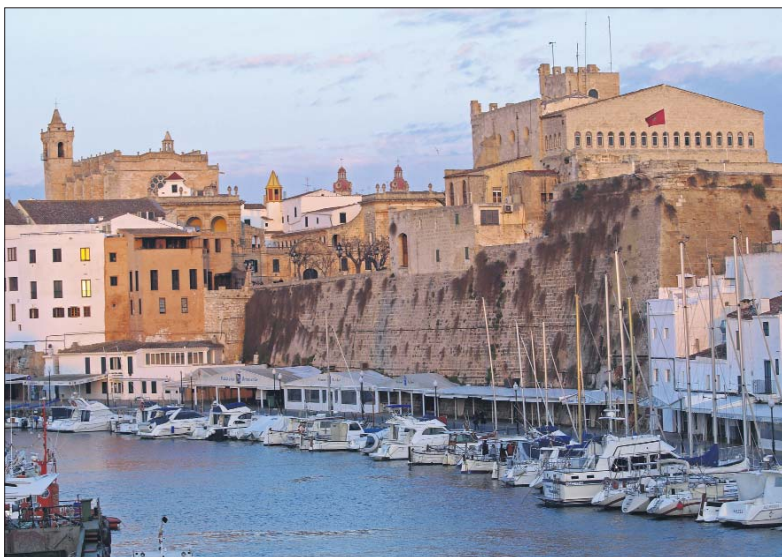
Imatge del port de Ciutadella, la reordenació del qual començarà aquest mes de setembre

Per altra banda, el Port Exterior de Ciutadella va rebre 101.451 passatgers entre els mesos de maig i juliol. El moviment de vehicles en